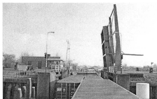
De 'Frisian Hopper' in de sluis bij Waalwijk.