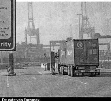
De gate van Euromax.